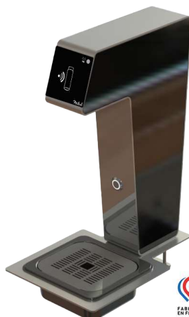
Eau froide Cold water