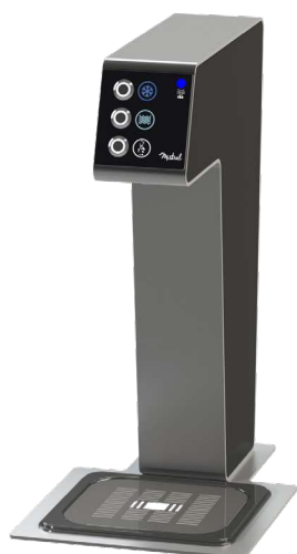
Eau froide, tempérée, gazeuse Cold, ambient and sparkling water