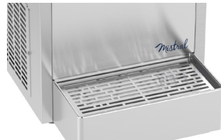
Bac de récupération d'eau raccordé à la vidange

Internal dispensing nozzle and sanitary protection with agion antibacterial treatment