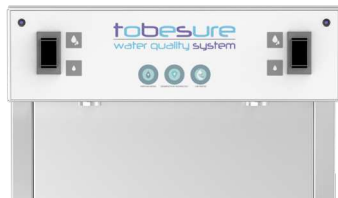
Buse de distribution interne et protections sanitaires avec traitement antibactérien en agion

Internal dispensing nozzle and sanitary protection with agion antibacterial treatment