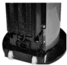
Integrierte Transportrollen für leichtes Umstellen