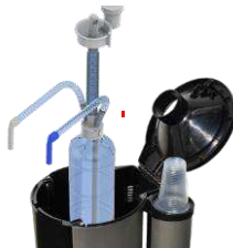
Vereinfachte Öffnung des Wasserspenders FBF 2.0 von oben zum schnellen Herausnehmen und Wechseln des Hygiene-Kits

Easy opening by the top of the FBF 2.0, allowing a fast extraction and replacement of the reservoir