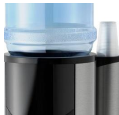
Umgekehrter Becherspender für optimale Hygiene

Easy opening by the top of the FBF 2.0, allowing a fast extraction and replacement of the reservoir